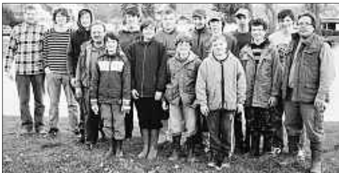
„Monheims Jungfischer mit ihren Betreuern nach der Flursäuberung“

Der Schutz unserer Umwelt ist ein erklärtes und in der Vereinsatzung verankertes Ziel der Monheimer Sportfischer. Und deshalb war es für unseren Fischernachwuchs eine Selbstverständlichkeit einen zusätzlichen Samstagvormittag diesem Zweck zu widmen und sich an der Aktion „Der AWW räumt auf!“ zu beteiligen. Verständlicherweise konzentrierten sich unsere Aktivitäten speziell auf den Gewässerrand- und Uferbereich der verschiedenen Vereinsgewässer in und um Monheim.