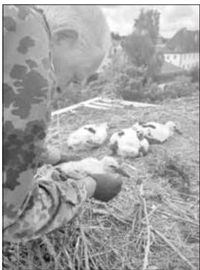
Die vier kräftigen Küken beim Gerstner Sägemehlbunker

Weiter ging es mit dem Horst beim Gerstner Sägemehlbunker. Hier kam die große Überraschung, dass sich vier kräftige Küken im Nest befanden. Alle Wohlauf und gesund konnten diese ebenfalls beringt werden. Dies sind bisher in Monheim die meisten Nachwuchsküken in einem Nest.