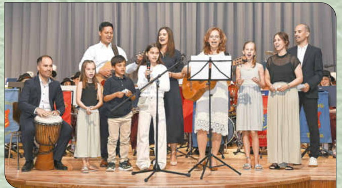
Familie Pfefferer trat als eigener Chor auf