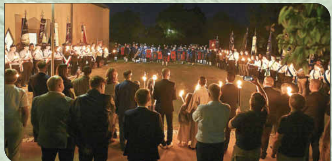
Feierlich war der Zapfenstreich zum Abschluss