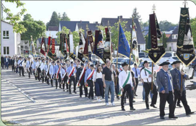
Die Vereine mit Fahnenabordnungen auf dem Weg zur Stadthalle angeführt von der Stadtkapelle Monheim

am 22. Mai 2026 in der Stadthalle Monheim