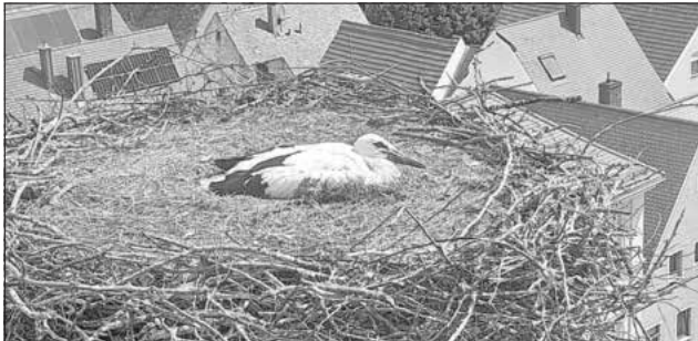
Ein großer, kräftiger Nachwuchs befindet sich im Nest am oberen Torturm

Nach der Begutachtung, Wiegung und Kennzeichnung kann er nun bald seine Flugkünste starten. Inzwischen steht er schon im Nest und macht Übungen.