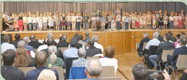
Die Kleinsten bei ihrem Spitzen-Auftritt