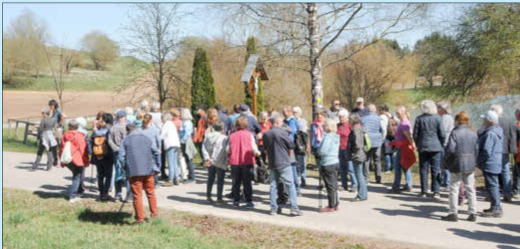
Die Route führte über den Wemdinger Weiher ins Schwalbtal

Über Wald- und Feldwege ging es schließlich vorbei am Fünfstetter Brunnenhaus zurück in den Ort. Begleitet wurde die Gruppe wie gewohnt von Fotograf Manfred Volkert, der die Wanderung mit stimmungsvollen Bildern dokumentierte.