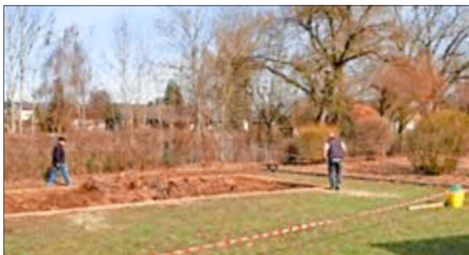
Text: Anna Loy