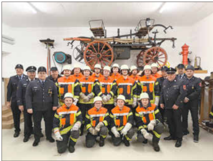
(Text & Bild: Manuel Roßkopf)

Insbesondere freute es ihn sehr, dass wieder alle an der Leistungsprüfung teilgenommen haben und zwei neue Feuerwehrmänner mit der Stufe 1 begonnen haben.