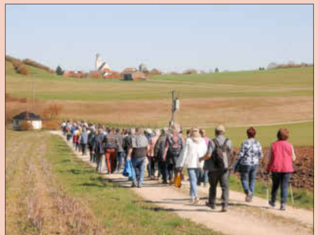
Letzte Wanderung am 08.04.2026 in Fünfstetten

Der Verein Soziales Miteinander e. V. freut sich auf viele gemeinsame, interessante und erlebnisreiche Wanderungen.