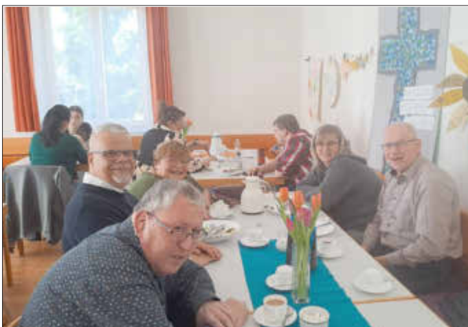
(Text; Helmuth Beck)