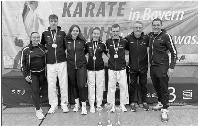
(Text und Bild: Thomas Brandner)

Mit diesem Rückenwind geht der Blick nun nach vorne – viele der Sportler bereiten sich bereits auf die kommende Deutsche Meisterschaft vor. Coach Thomas Brandner zeigt sich optimistisch: Die Form stimmt, die Motivation ist hoch – und das nächste Highlight wartet bereits.