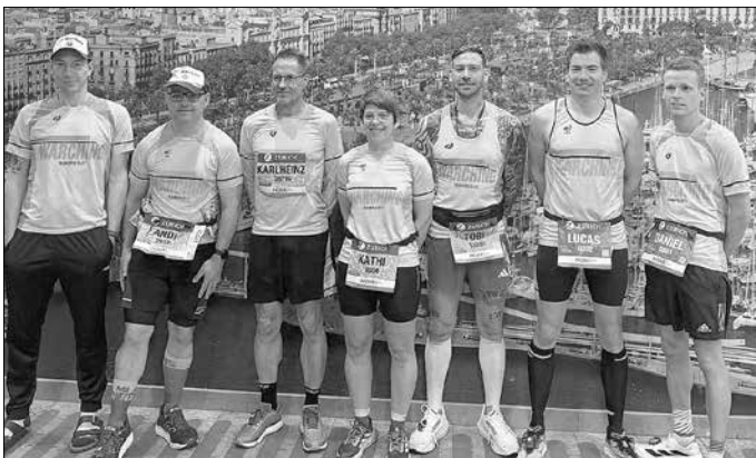
Die 7 Marathonis