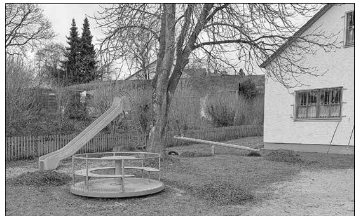
Freiwillige Feuerwehr Rehau (Marina Knoll)