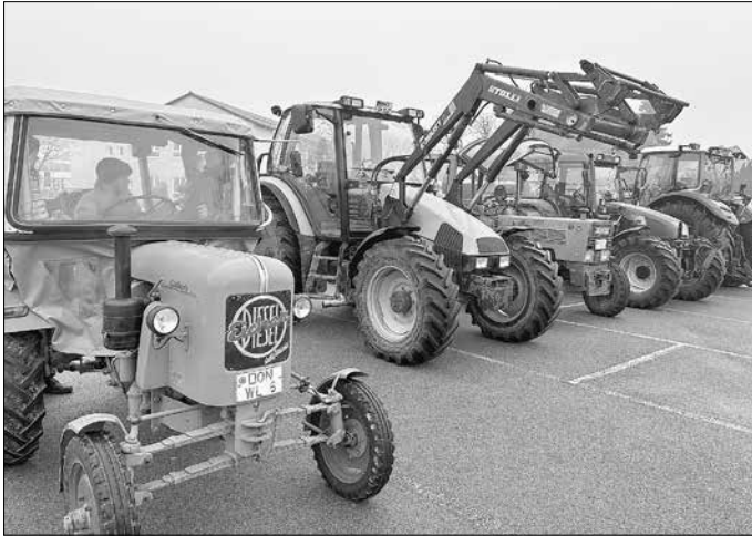
(Elke Egger, Mäusegruppe)

Nicht nur die Kinder hatten großen Spaß, auch das Kindergarten- und Krippenpersonal genoss die Aktion. Vielen herzlichen Dank an die Opas und den Onkel für die schöne und unvergessliche Zeit.