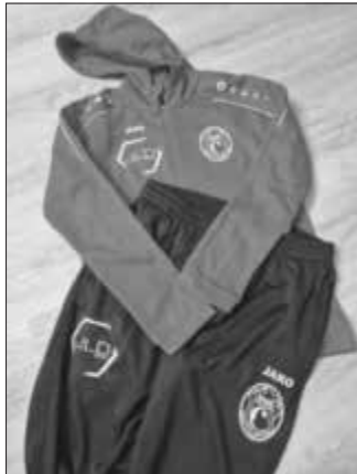
Trainingsanzüge mit Vereins- und Firmenlogo