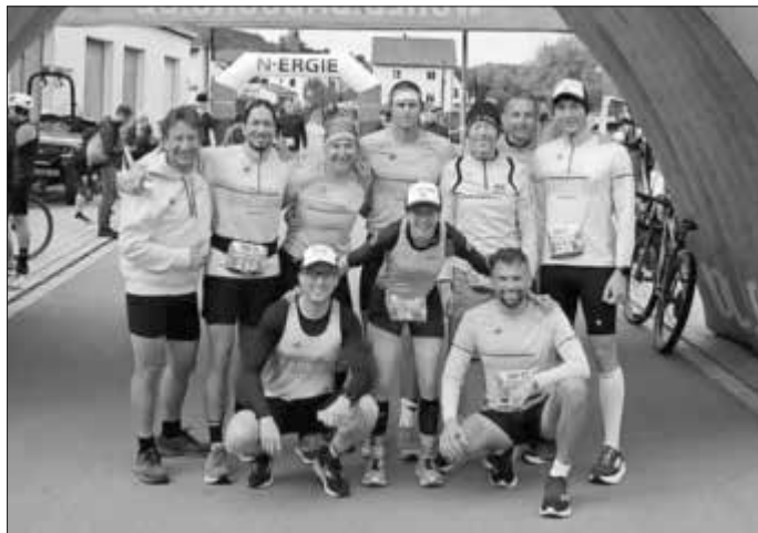
Trailrunner der LG Warching