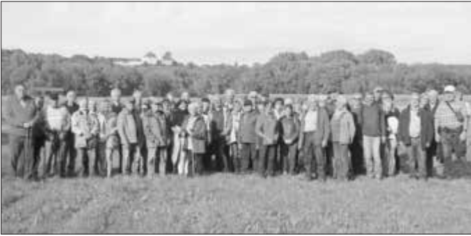
Die stattliche Truppe vor der Kulisse „Schloss Leitheim“