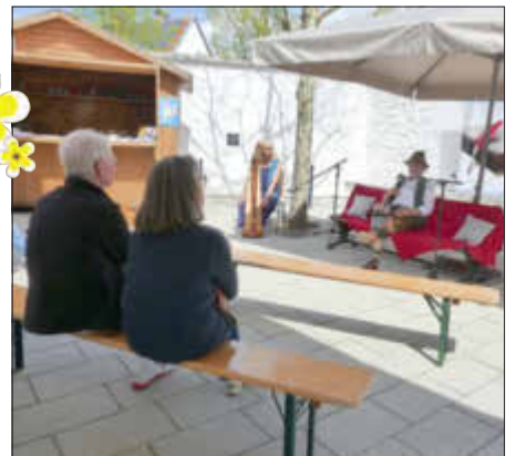
Der Autorenclub Donau-Ries mit der „Roten Bank“ im Kulturhof