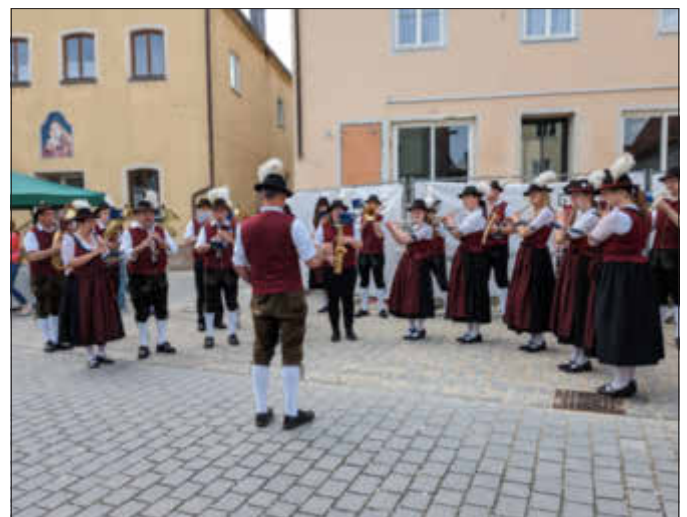
Die Stadtkapelle in vollem Einsatz