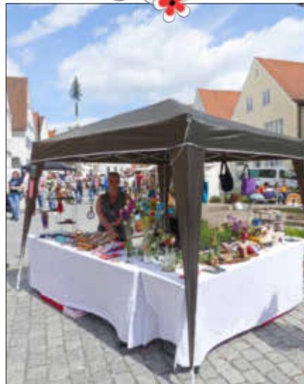
Filzarbeiten auf dem KunstHandWerkMarkt