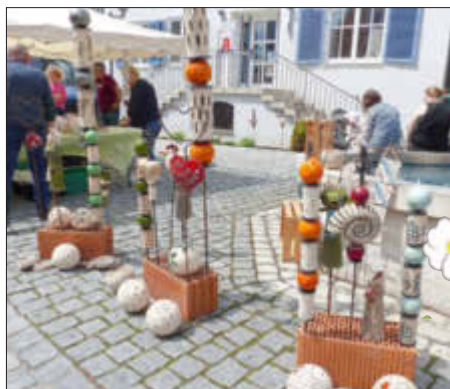
Töpferware für Haus und Garten