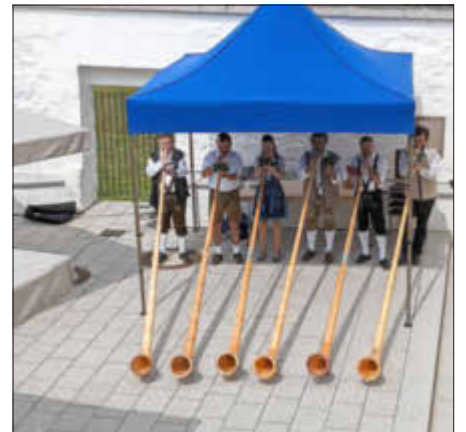
Die Daitinger Alphornbläser in Aktion