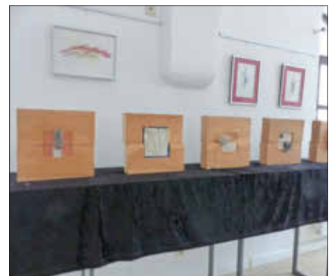
Kunstwerke vom Steinmetz und Bildhauer Helmuth Hampel im Haus des Gastes