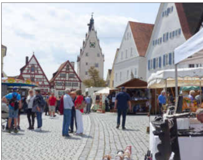
Ein Spaziergang über das Marktgelände