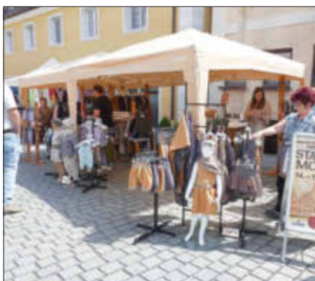
Schöne Stände auf dem Marktgelände