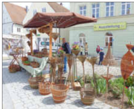
Altes Handwerk - Weidenflechten