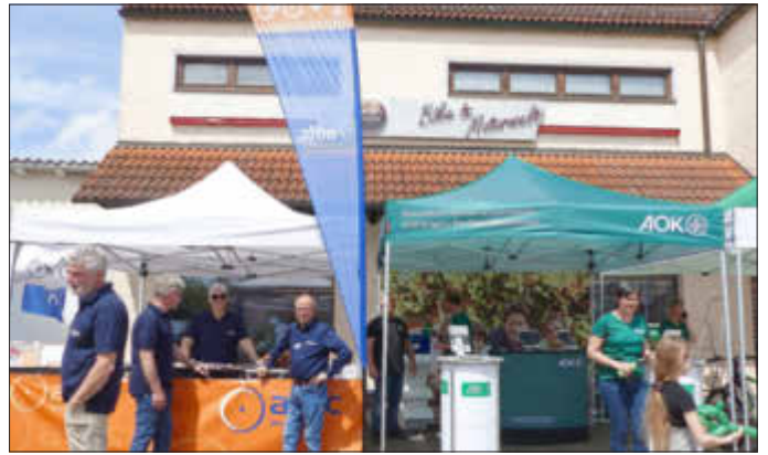
Die AOK Gesundheitskasse und der Deutsche Fahrradclub ADFC vor Ort bei Bike & Motorwelt