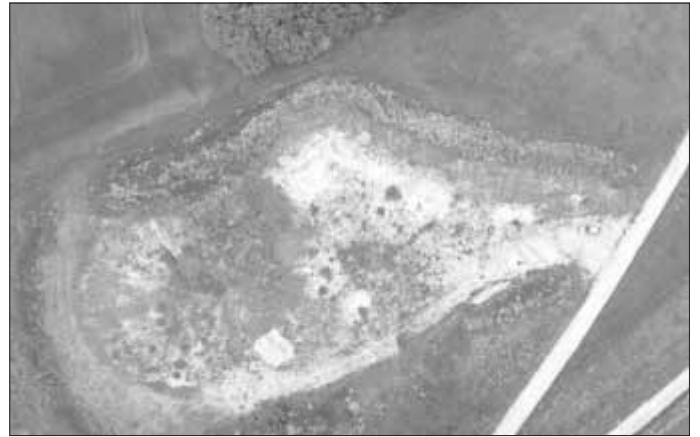
Luftbild: Bohnerzgruben Erlebnis-Geotope Daiting

Natürlich änderte der Einschlag des Ries-Asteroiden vor 15 Millionen Jahren die Geologie drastisch und macht sie heute sehr abwechslungsreich. Aktiver Naturschutz, ehemalige Steinbrüche als Lebensräume für seltene Tier- und Pflanzenarten sowie die Bedeutung der Schafbeweidung sind weitere Themen des Lehrpfads. Für Unterhaltung sorgt ein Pflanzenquiz für Groß und Klein, das die Wanderer auf ihrem Weg begleitet. Wer mehr möchte, kann die Strecke um zwei Kilometer verlängern.