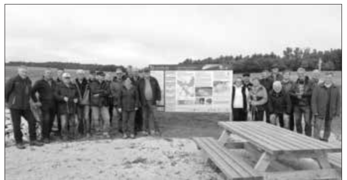
Die Wanderwegewarte am Erlebnis-Geotop in Daiting