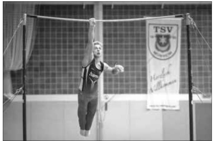
Einarm-Riesenfelle für die entscheidenden Momente am letzten Gerät Reck.