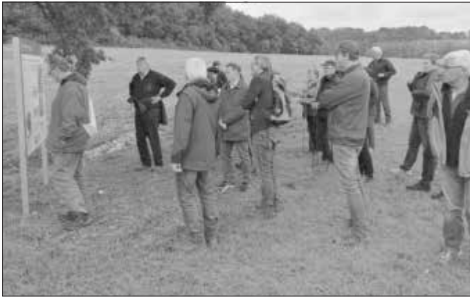
Eine der Infotafeln entlang des Lehrpfads