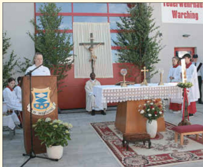
Die kirchliche Weihung des Gebäudes erfolgte durch Kaplan Josef Korerimana