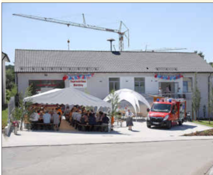
Bei bestem Wetter konnte das Feuerwehrhaus Warching eingeweiht werden