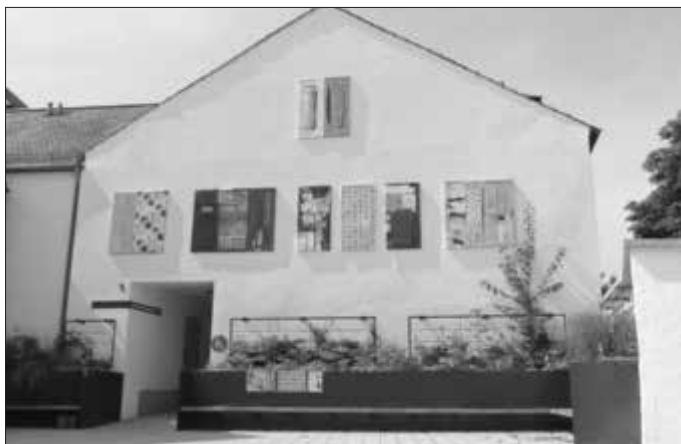
Der Kunstpfad 2019 im Kreuzwirt Innenhof in Monheim

Nach den großen Erfolgen der Kunstpfade 2016 und 2019 wird es auch dieses Jahr wieder ein Kunstprojekt im Landkreis geben, organisiert vom Regionalmanagement Donau-Ries.