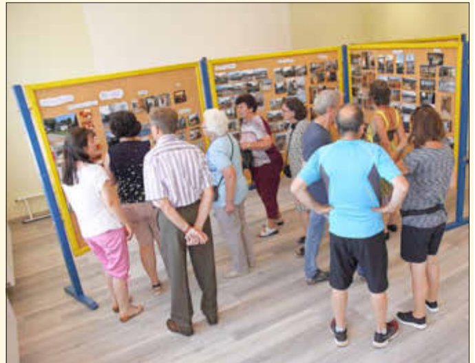
Schautafeln mit Bildern zum Bauverlauf des neuen Dorfzentrums Warching