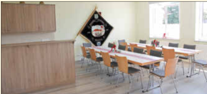
Schulungsraum der Feuerwehr Warching „Floriansstüberl“