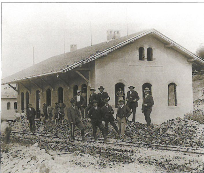
Bahnwärterhaus bei der Bahnunterführung unter der Straße Wemding-Monheim 1906

entwurfes an die Kammer der Abgeordneten deutlich. Ging doch aus der Presseberichterstattung nun auch hervor, dass für alle Bahnhöfe an der Neubaustrecke Signal- und Weichenstellwerke vorgesehen waren.